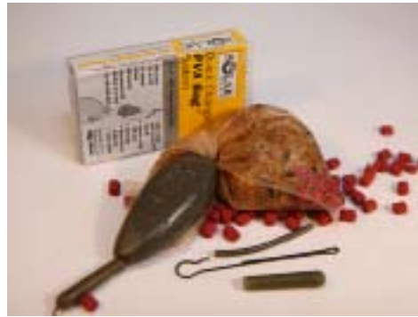
Das Clip System von Solar für Inline-Bleie