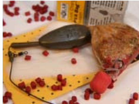
Verführerisch: ein Beutel voller Lockwirkung

Wasser, sondern ausschließlich mit flüssigen Lockstoffen. Und gerade jetzt im kalten Wasser reagieren die Fische sehr gut auf intensive Düfte. Auch Pellets sind jetzt top, solange sie nicht vor Öl triefen. Öle sind zwar auch im Winter attraktiv für