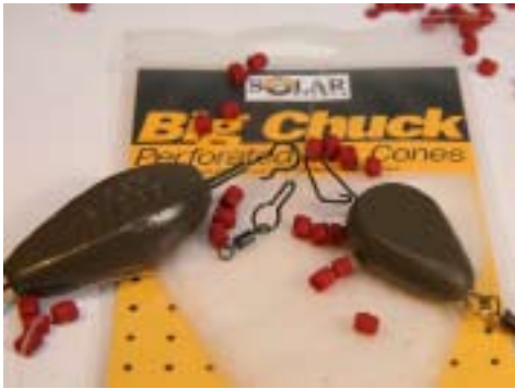
Drei Varianten: Ring-Wirbel, Inline-System und Blei