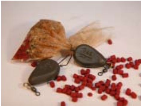
Die einfachste Variante: das PVA-Blei von MAD®