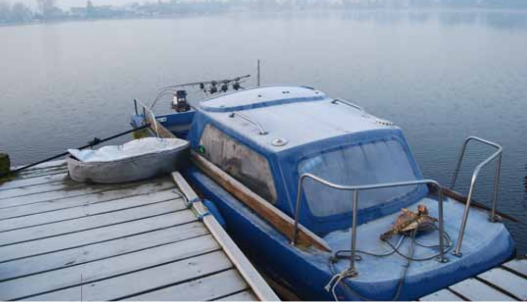
Het is knap koud en de boot is 's ochtends bedekt met rijp.

vertrouwen en ten tweede omdat het gewoonweg werkt. Het blijft altijd een lullig gevoel om slechts 200 tot 400 gram boilies te voeren. Maar goed, in dit geval schaadt overdaad zeker wel. Mijn winterstek is vanuit de boot zeer makkelijk te bevissen. Ik kan hem namelijk eenvoudig aan een steiger vastleggen. Twee simpele touwtjes doen het werk. Een anker en steekstokken zijn hier nog niet aan de orde.