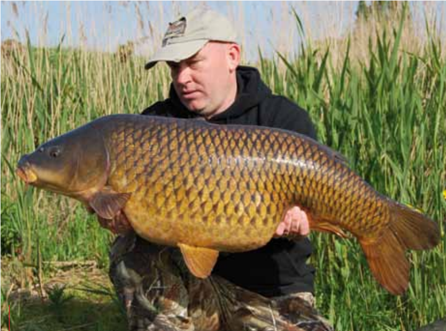
Ruimte houden voor een bijschrift xxxxxxxxxxxxxxxxxxxxxxxxxxxxxxxxxxxxxxxxxxxxxxxxxxxxxxx

weg onvindbaar is. Deze aprilmaand lukt het me om diverse twintigers in de boot te krijgen. De eerste dertiger komt pas aan het eind van de maand, een mooie schub van 16,3 kilo.