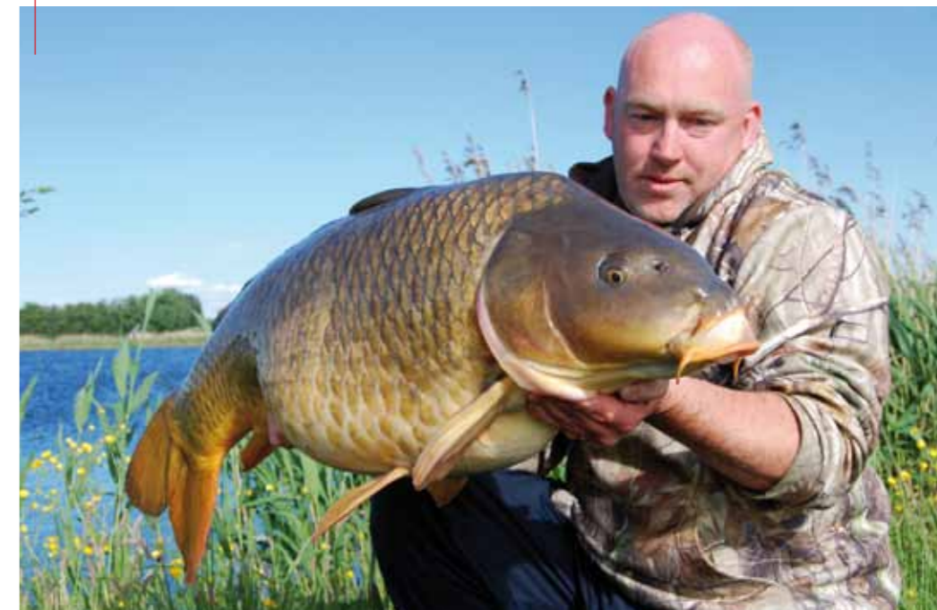
Ruimte houden voor een bijschrift xxxxxxxxxxxxxxxxxxxxxxxxxxxxxxxxxxxxxxxxxxxxxxxxxxxxxxxxxxxxxxx

palen zwemt. Door de hoek die ontstaat zijn ze er dan vrijwel meteen af. Gelukkig heb ik zo iets slechts een enkele keer per seizoen. Ik houd de shade dus aardig beperkt.