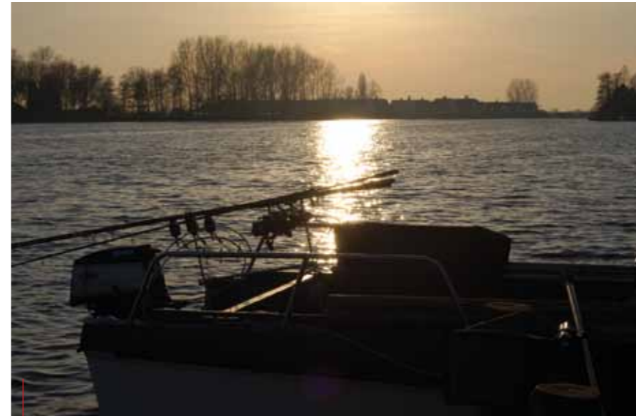
Ruimte houden voor een bijschrift xxxxxxxxxxxxxxxxxxxxxxxxxxxxxxxxxxxxxxxxxxxxxxxxxxxxxxxxxxxxxxx

Uiteraard vis ik niet al te strak tegen de obstakels aan, zoals in het water gevallen bomen, wierbedden, lievelvelden en steigers. Mijn motto is, dat ik liever drie runs heb die ik ook werkelijk vang, dan dat ik er vijf krijg, waarvan ik er twee vang en ik de verspeelde vis achterlaat met een hoop ellende. Visveilige rigs zijn voor iedere visser. Ik vind dat niemand het nog kan maken om met een visonvriendelijk systeem te vissen.