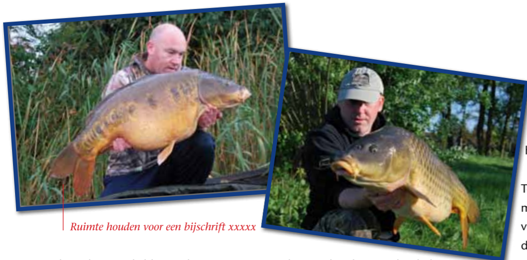
Ruimte houden voor een bijschrift xxxxx

de trailers getakeld. Mijn kansen en de karperkoorts laaien weer op. Zo'n zomerbreak heeft als voordeel dat je meteen weer goed gemotiveerd bent om er nog even vol tegen aan te gaan. Want na zes weken geen hengel aangehaakt te hebben, is de zin in een kromme hengel weer behoorlijk toegenomen. Gelukkig zitten de karpers er vanaf de eerste sessie meteen weer volop. De eerste avond vang ik binnen twintig minuten al een vis van veertien kilo en